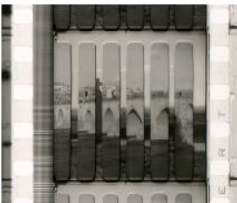
Ayer y hoy en Castilla