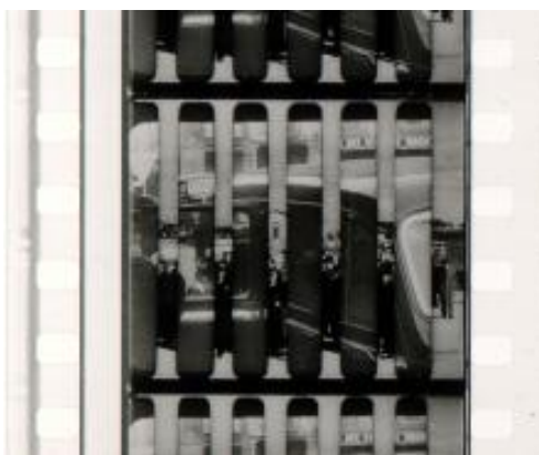
Noticiero español n° 30

Una original cortinilla de transición que aparece en "Ayer y Hoy en Castilla" en el primer romance, es idéntica a la que da paso en el Noticiero Español" n° 30, de la 3° noticia, la firma del Ministro de AA.EE., Beigbeder y el Embajador de Francia, Pétain, de un acuerdo comercial entre ambos países, a la 4° noticia, la citada construcción del viaducto sobre el pantano del Esla, permite afirmar que los dos materiales han sido tirados en el mismo laboratorio, quizás, en un período de tiempo no especialmente dilatado.