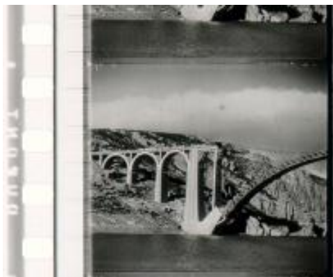
Noticiero español n° 30

Por comparación, con el estado de las obras que recoge las imágenes que aparecen en el "Noticiero Español" n° 30 (4° noticia), con fecha de edición febrero de 1940, que recogen la visita del Ministro de Obras Públicas Alfonso Peña Boeuf a las obras con las que aparecen "Ayer y Hoy en Castilla", cabe pensar que parte de su rodaje tuvo que ser posterior al del Noticiero.