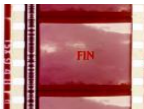
Copia 768 (35m/m)