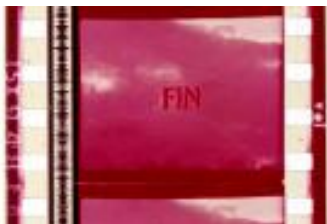
Copia 1095 (35m/m)

Las copias presentan una degradación del color muy avanzada, la menos degradada es la 765 en 16m/m, con un metraje, sólo un segundo inferior a las copias más completas, la 768 y la 1095, las dos en 35 m/m. Existe una leve diferencia en la gravedad de la degradación, a favor de la copia numerada como 768, también es distinta la tonalidad en ambas copias, la 768 tiende al marrón, la 1095 al magenta, solo que la primera presenta menor densidad que la segunda.