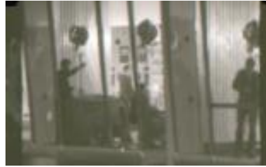
Salto del Sil nº 7