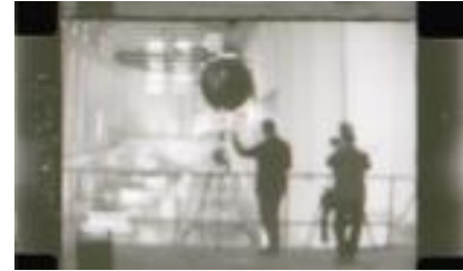
Salto del Sil nº 7

En 16 m/m también hay que vincular como materiales de “Por la Cuenca del Sil” a los Reportajes para TVE de Iberduero nº 1 y, parcialmente, al 2. El primero, compuesto por tres rollos de negativo de imagen montados en uno, con imágenes de los Saltos de Sequeiros, Montefurado y Pontenovo, con planos que, en algunos casos, son similares a los montados en este título.