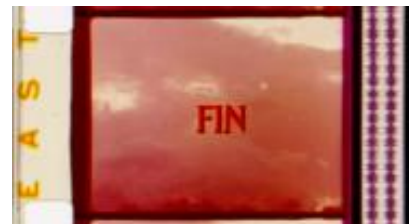
Copia 765 (16m/m)