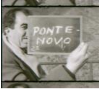
Reportaje TVE nº 1

negativo en 35m/m de este título. Materiales de similares características, aparecen con etiquetas de fabricante de materiales específicos para televisión.